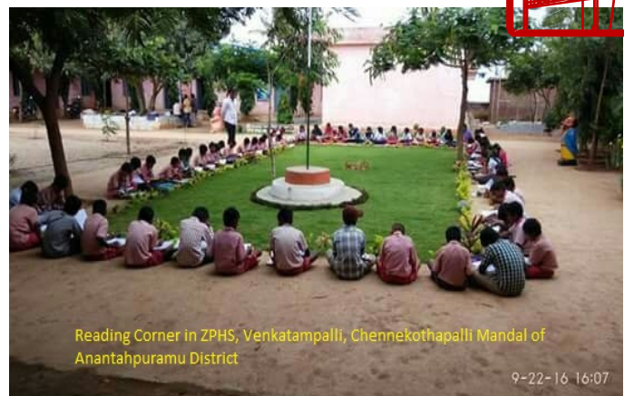
Reading Corner in ZPHS, Venkatampalli, Chennethapalli Mandal